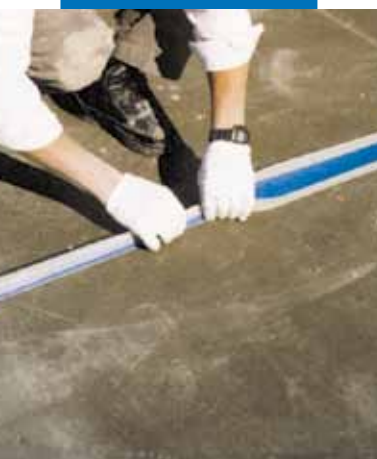
Παράδειγμα στεγάνωσης κατασκευαστικού αρμού σε ταράτσα