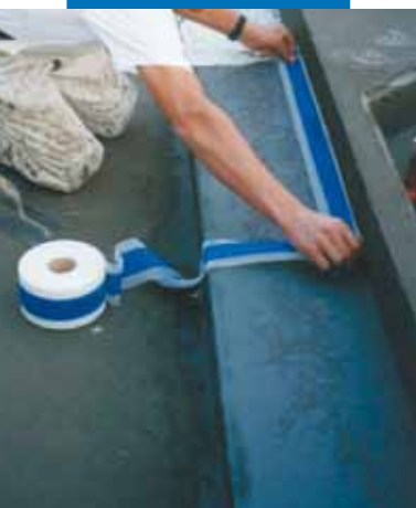
Παράδειγμα στεγάνωσης με Mapeband γωνία μεταξύ δαπέδου και πλευράς σε ντουζιέρα