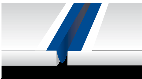
Τοποθέτηση του Mapeband μέσα σε αρμό διαστολής σε σχήμα ανεστραμμένου Ω